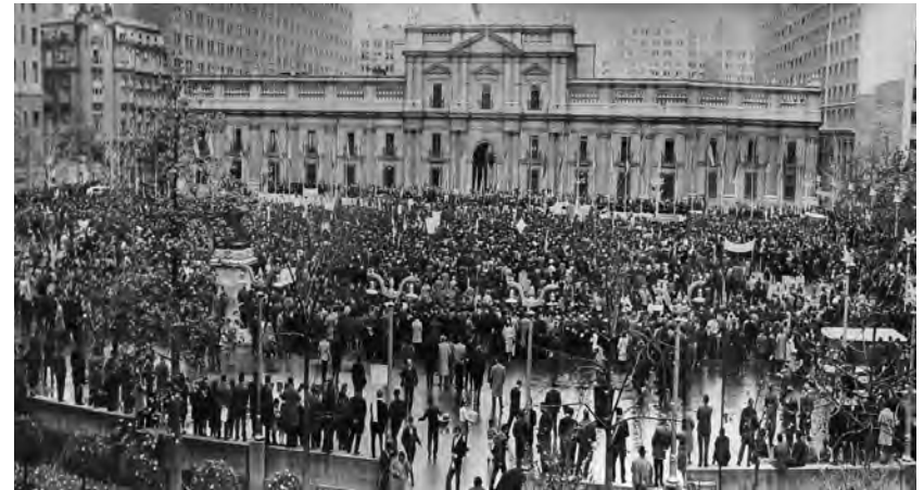
Promulgación de la Reforma Agraria. 1967

Se aprobó la nueva Ley de Reforma Agraria (N°16.640), cuyo objetivo original fue romper la concentración de la propiedad de la tierra e