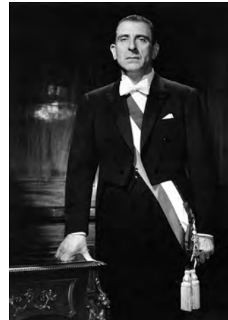
Eduardo Frei Montalva (1911 - 1982)

Nueva Ley de Reforma Agraria No 16.640 (1967)