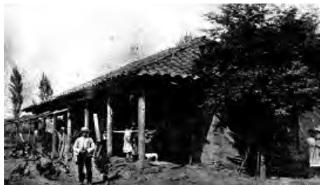
El inquilinaje en Chile

A mediados del siglo XVII, el aumento demográfico de mestizos libres y la progresiva desaparición de los indígenas en la zona central conllevó al sistema de inquilinaje, mediante el cual mestizos y españoles pobres se instalaron en los terrenos alejados de las grandes estancias ganaderas, a cambio de un pago anual en especies.