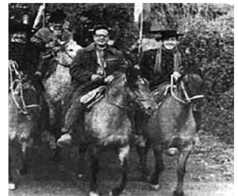
Presidente Salvador Allende

Durante el Gobierno socialista de la Unidad Popular de Salvador Guillermo Allende Gossens (1971-1973), se expropiaron sobre seis millones de hectáreas de tierra, las que fueron traspasados a la administración estatal, organizando cooperativas campesinas, asentamientos, centros de reforma agraria o centros de producción campesinos.