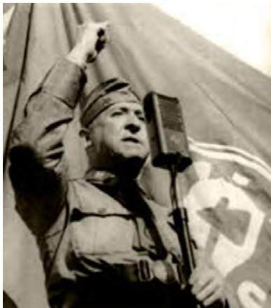
Marmaduke Grove Vallejo (1878 - 1954)

La tierra, debería ser por reconocimiento constitucional de quienes la trabajan; solo ellos reconocen su verdadero valor. Fue esa la máxima aspiración de aquellos que dieron grandes pasos para cumplir este sueño de miles de chilenas y chilenos y, debiera ser una prioridad para quienes tienen y tendrán en sus manos la responsabilidad de preservar tan preciado recurso para producir los alimentos que el país necesita.