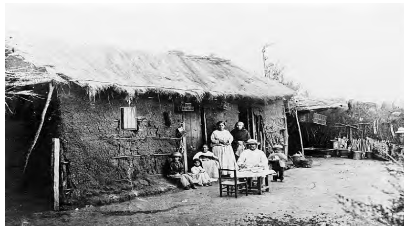
Inquilinos en el rancho

Hasta mediados del siglo XX, el latifundio fue el principal actor que rigió la forma de las relaciones socioeconómicas y culturales en el campo; relaciones paternalistas entre dueño y campesinos. El analfabetismo era masivo y no había acceso a los productos de consumo. Los trabajadores percibían un sueldo menor que un obrero de la ciudad, del cual sólo recibían el 25% en dinero, ya que el resto era para insumos que sacaban de la pulpería del fundo.